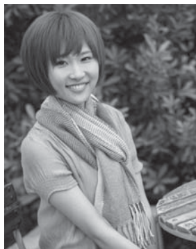
1 2 ページの作品