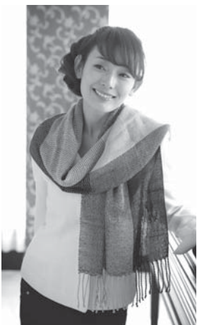
2 7 ページの作品