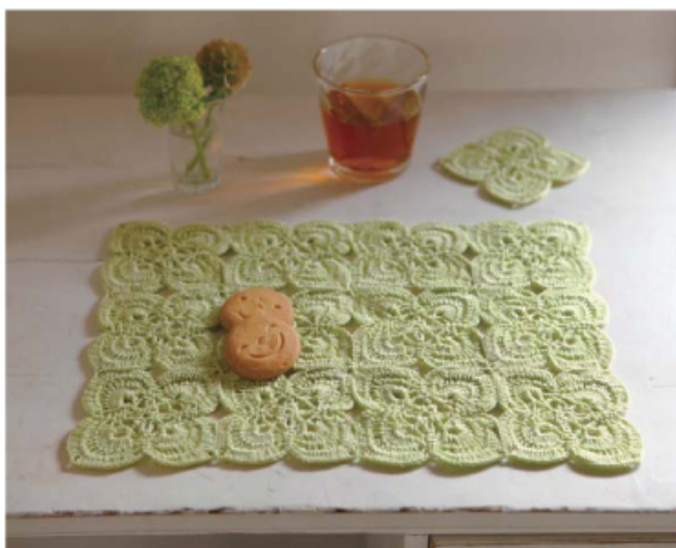
さわやかな若葉色が新鮮なカフェアイテムのセットです。四つ葉のクローバーをつなげたような愛らしいデザイン。