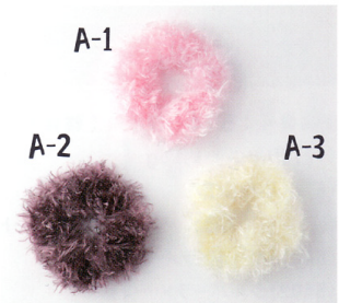
図1のように作り目して、立ち上がり 3目編んでヘアゴムをはさみ込むよ うに長編みと鎖編みで編みます。 ※長編みは足を長く編みます。