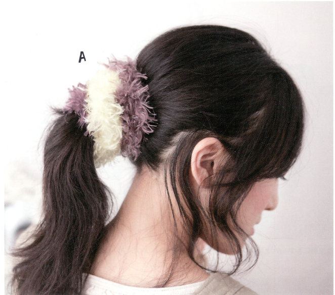
色違いでたくさん欲しい、ボリューム感が嬉しいシュシュ。2コ使いも可愛いです。